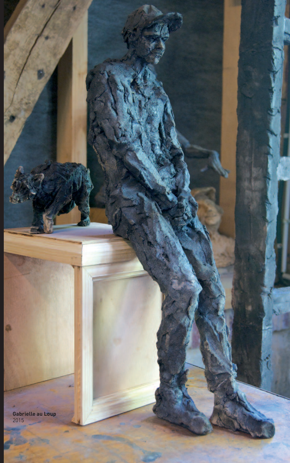
Gabrielle au Loup 2015

Réalisation : bdsa - Imprimé à 400 exemplaires chez ETC - Octobre 2015