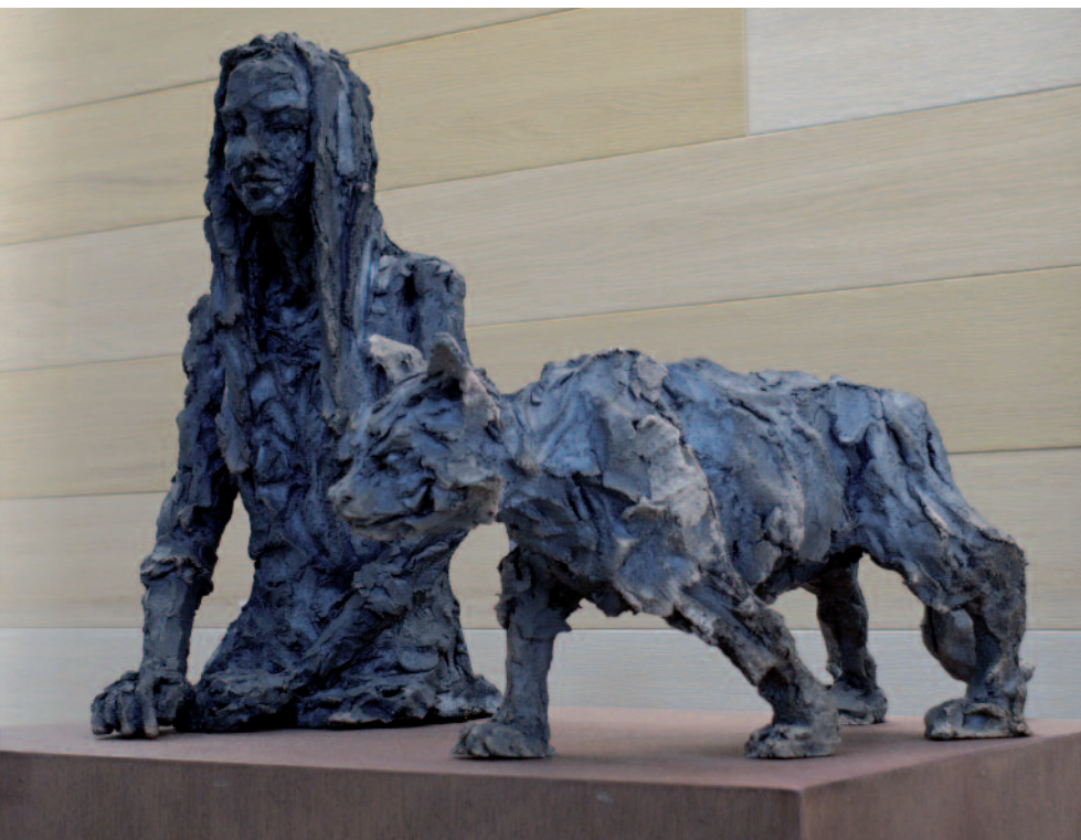
Dans les ombres d'Alice (avec Barbara et grimaçant) 2014 Collection particulière