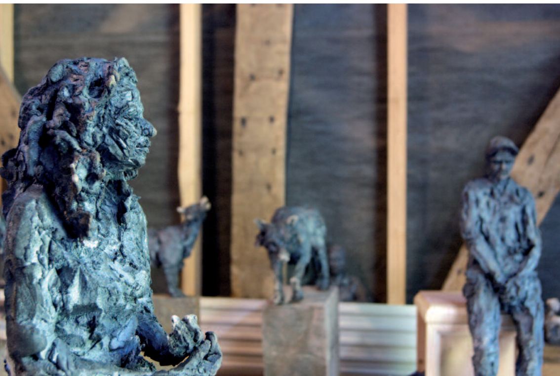
Vestibule des Pommes (avec Gladys et Gabrielle au Loup) 2015