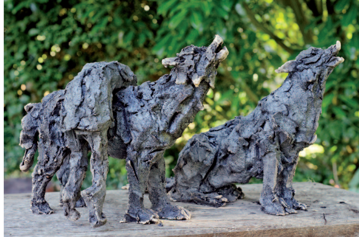
Vestibule des Pommes (avec Martin) 2015