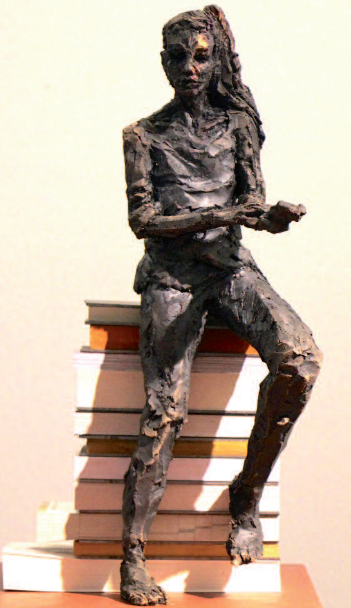
Eve ex-cetera (avec Clarisse) 2014 grès enfumé, livres, acier