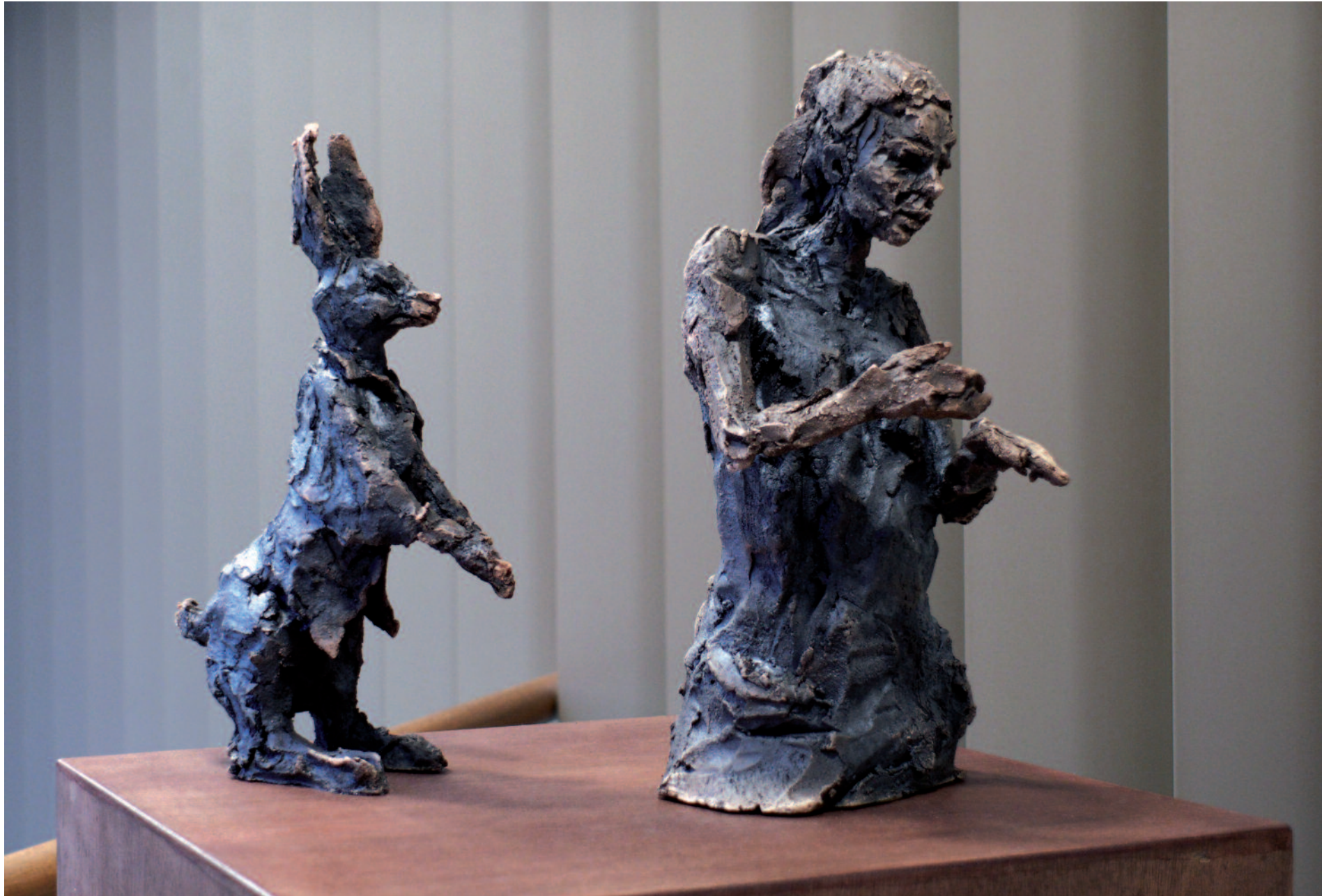
Du Temps au temps (avec Clémentine et lapin noir) 2014 Collection particulière