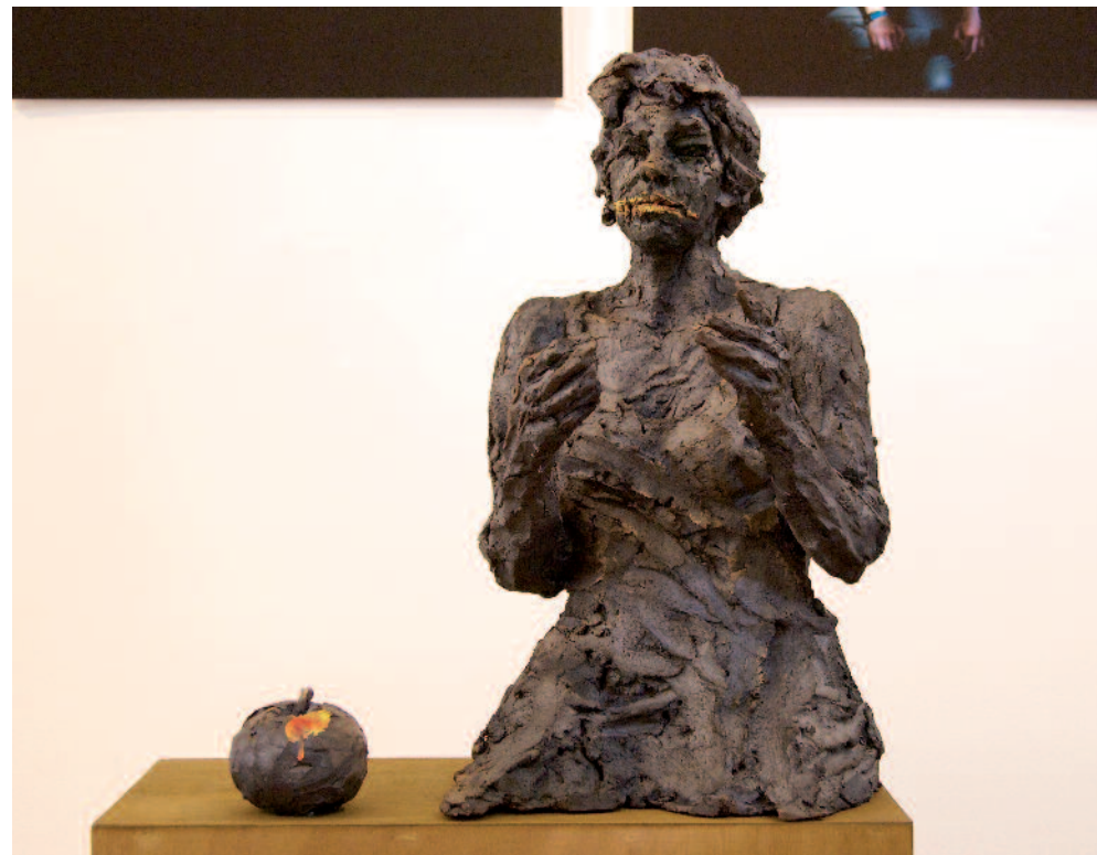
Tel un secret 3 2015 (détail)